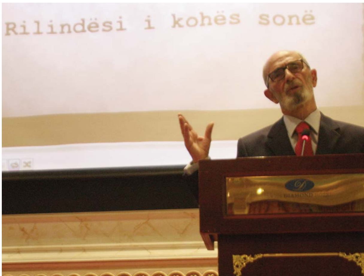
Mbijetesa e figurës së Qosjes nis tashmë, kur kritikëve do t'u duhet t'iu kthehen shqyrtimeve dhe analizave të tij letrare dhe politike dhe përpjekjes për ta harruar

Si për paradoks, tani që Qosja ka mbyllur sytë, shqiptarët janë e mbeten të vonuar. Për trishtimin e tij e të të gjithë shqiptarëve që mendojnë. Këtu janë ngushëllimi dhe respekti për të, këtë mendje të paepur të së vërtetës kombëtare. Pa frikë e vendosi gishtin në plagën e madhe kombëtare, sikur ia drejtoi vetes: Si gjithnjë të vonuar