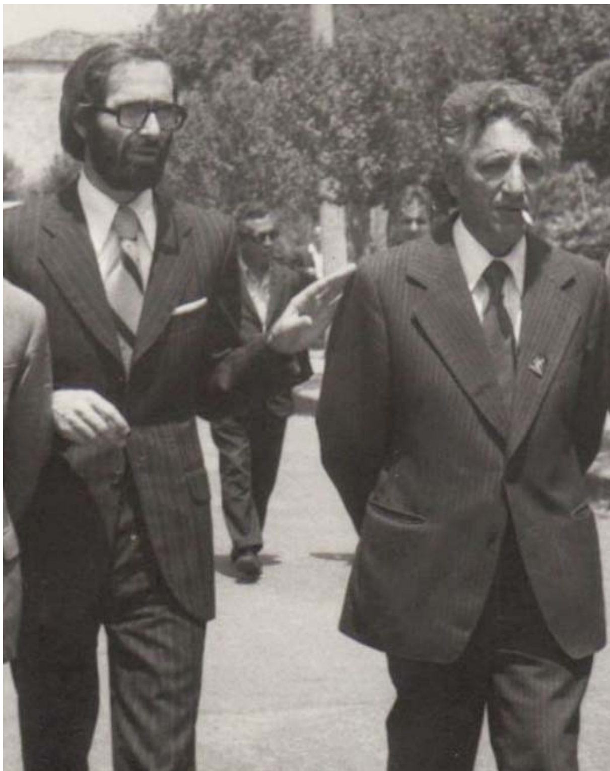
Rexhep Qosja dhe Dritëro Agolli më 1972 në Tiranë

Viti 1970 është i begatshëm sa i përket dokumentacionit që lidhet me personalitetin e Profesor Rexhep Qosjes, sepse gjatë këtij viti Profesori do ta vizitonte Shqipërinë dhe sigurisht se ka prodhuar material edhe për përgatitësit e relacioneve. Prej datës 6 deri më 28 janar 1970 Profesor Qosja qëndron në Tiranë si i ftuar nga Universiteti Shtetëror i