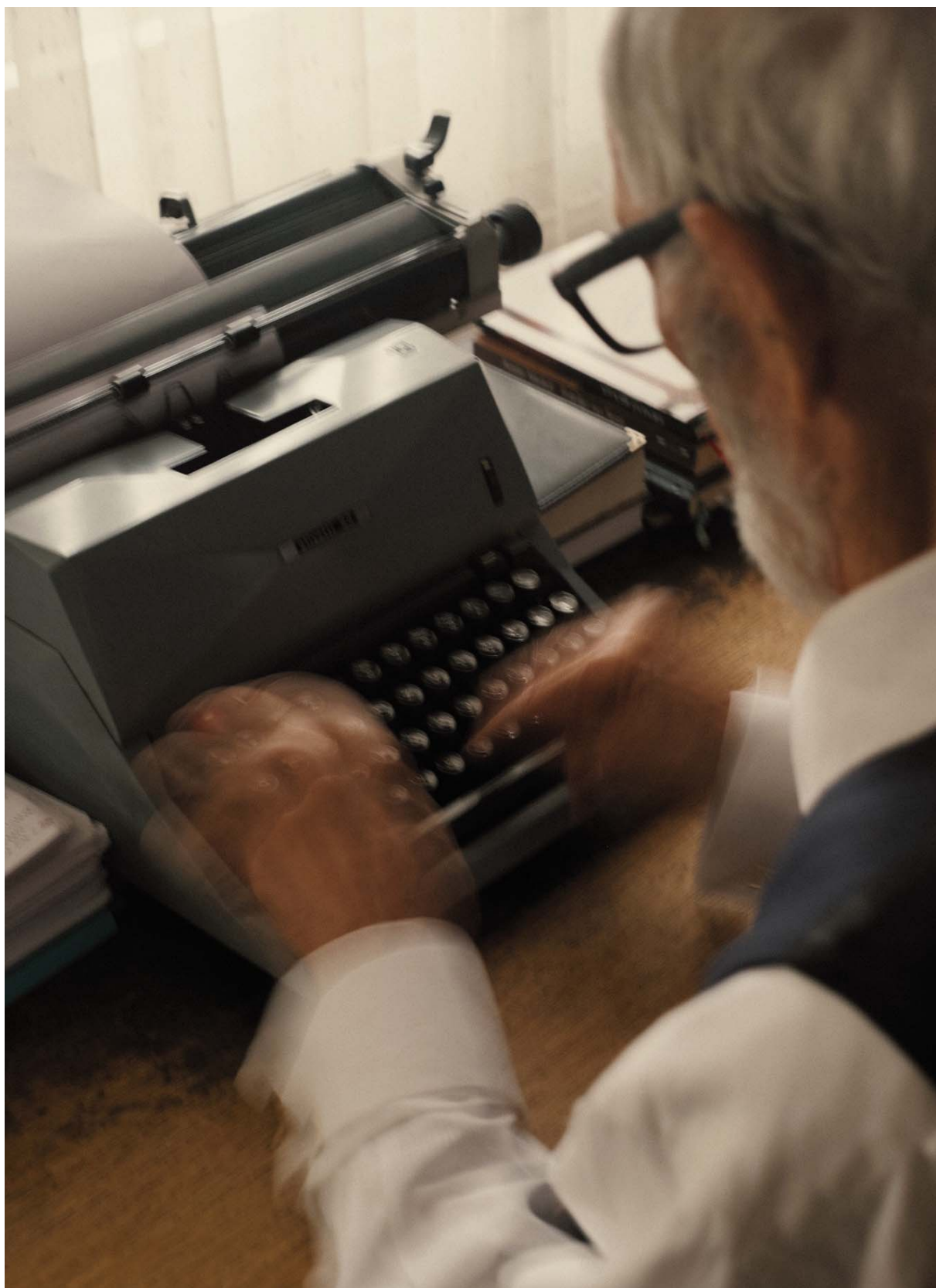
Forcat aktive të vullnetit në punën krijuese e intelektuale të prof. Rexhep Qosjes do të jenë motori që do ta vënë në lëvizje mendimin e tij në frontin e bërjes dhe vetëbërjes së Vetes sonë komb me vetëdije moderne kulturore

një dogmë politike mund të burojë nga një arsye e re dogmatike, e cila i sjell një robërim të ri mendjes, ndërsa emancipimi që arrihet përmes arsyes kritike në mënyrë analitike e arrin fuqinë mbi paragjykimin dogmatik.