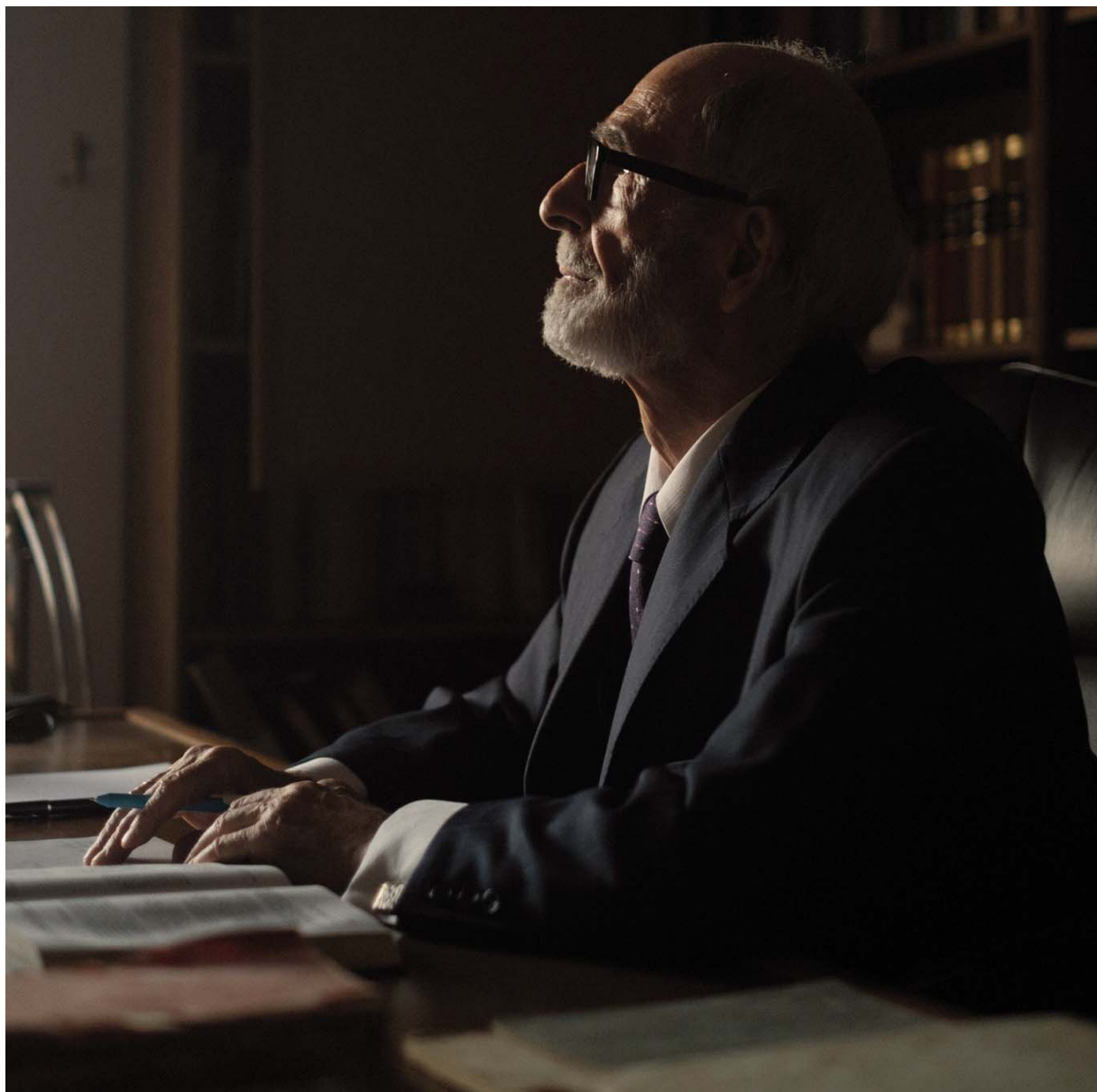
Janë më se 50 vepra shkrimore dhe më se 20 mijë faqe të shkruara e të botuara, madje një pjesë e konsiderueshme e tyre edhe të përkthyer në gjuhë të tjera, që e bëjnë Akademik Rexhep Qosjen një autor të patëdytë në historinë dhe në kulturën shqiptare

Një fushë tjetër me rëndësi e veprimtarisë intelektuale e profesionale të Rexhep Qosjes ka të bëjë me studimet tona letrare. Për punën e tij shkencore janë thënë fjalë të mëdha. Puna dhe rezultatet e tij janë kraha-