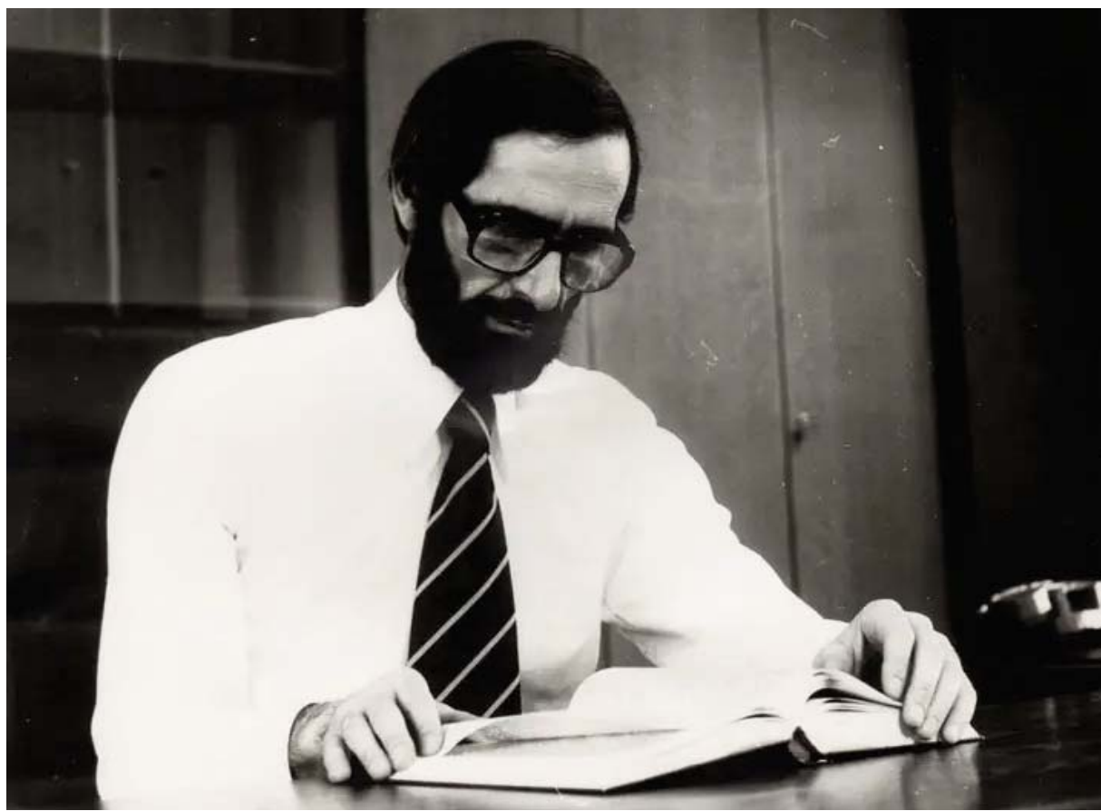
Akademik Rexhep Qosja është krijues letrar dhe studiues i jashtëzakonshëm i historisë së letërsisë shqipe. Vepra e tij letrare dhe shkencore ka zënë vend të merituar në thesarin e letërsisë, kulturës dhe të shkencës së letërsisë

Në parathënien e antologjisë (35 faqe tekst) përmbledhen rezultatet e deriatëhershme të studimit të lirikës dhe përgjithësisht të letërsisë shqipe, metodologjia e hartimit të antologjisë dhe shqiptohet vlerësimi